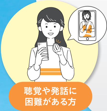
聴覚や発話に 困難がある方